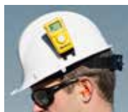
Clip für Schutzhelm