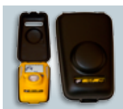
Gehäuse für Ruhezustand